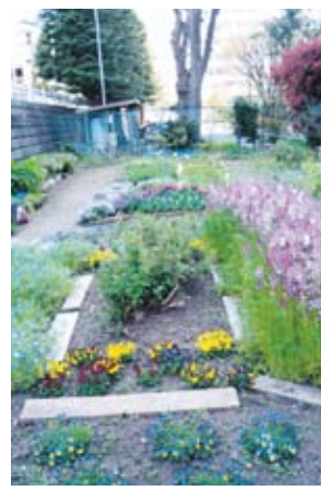
妙蓮寺ハウス隣接のお花畑

長年花を世話してきた「お花畑の会」の関係者によりますと「平成15年から始め16年間育て続け、たくさんのお花を咲かせ、地域の皆様にも大変好評を得ていきました。ここに来て運営が難しくなり令和2年3月末をもって横浜市へ返還します。長い間見守り続けていただいた地域の皆様に心より感謝、お礼申し上げます」とのことでした。