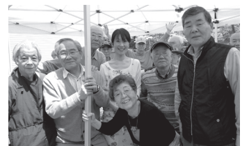
美味しさは笑顔に！

伊東美奈子・植木幹造・江村清 押尾泰典・三宅博久・宮田純子 和田恵美子 編集責任者…中村泰雄