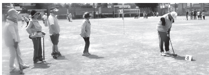
健闘する仲手原チーム！

我が仲手原チーム6名は16ホールを26アンダーの262と健闘しましたが、優勝チームのグリーンコーポには11点、準優勝チームの篠原コーポラスには1点及ばず3位でした。