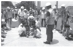
毛布による担架体験