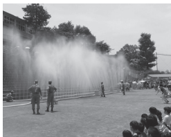
ウォーターカーテン見学