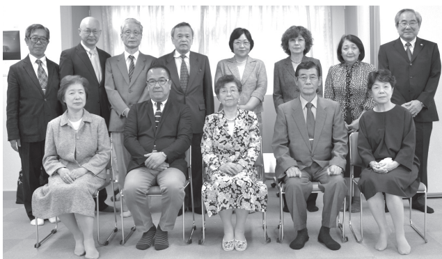
平成27年度自治会役員

自治会館の平時の維持管理方法や、非常災害時に備えての増築や避難口の増設などの検討・推進。